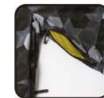
ベンチレーション

【素材】(表)ハニカムソリッドプリント4-wayストレッチタフタ2L(ポリエステル100%)、4-wayストレッチタフタ2L(ポリエステル100%)、CORDURAオックス(ナイロン100%) (裏)トリコット(ポリエステル100%)、タフタ(ポリエステル100%)、ブラッシュドトリコット(ポリエステル100%) (中わた)Thunderon® DIGENITE THERMO (ポリエステル94%、アクリル6%)、ポリエステル100% 【原産国】中国 【着丈】79cm(L)