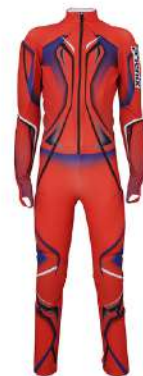
FLRD / Flame Red