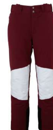
B01 / Bordeaux1