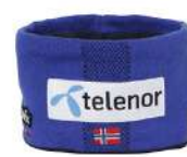
RB / Royal Blue