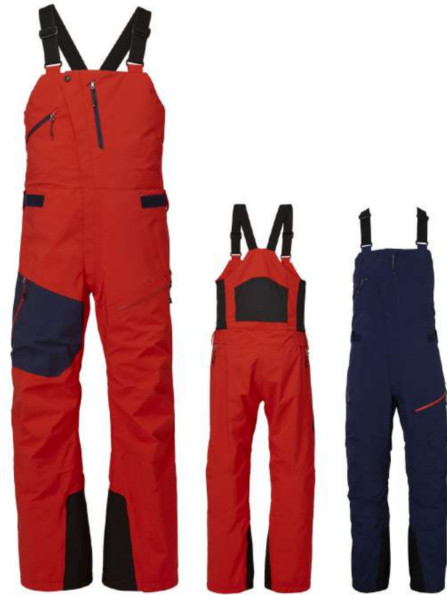
FLRD / Flame Red