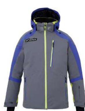
GR / Gray