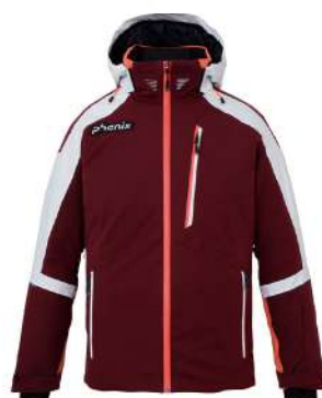
B0 / Bordeaux