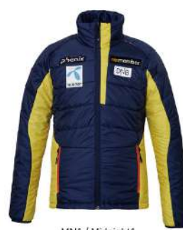
MN1 / Midnight1