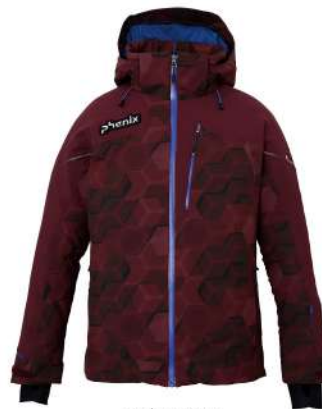
BO / Bordeaux