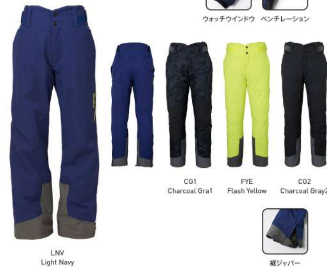
CG1 Charcoal Gray FYE Flash Yellow CG2 Charcoal Gray