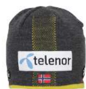
CG / Charcoal Gray

【素材】〈表〉ニット(アクリル100%) 〈裏〉吸汗速乾フリース(ポリエステル95%、ポリウレタン5%) 【原産国】中国