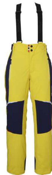
GY1 / Gold Yellow1