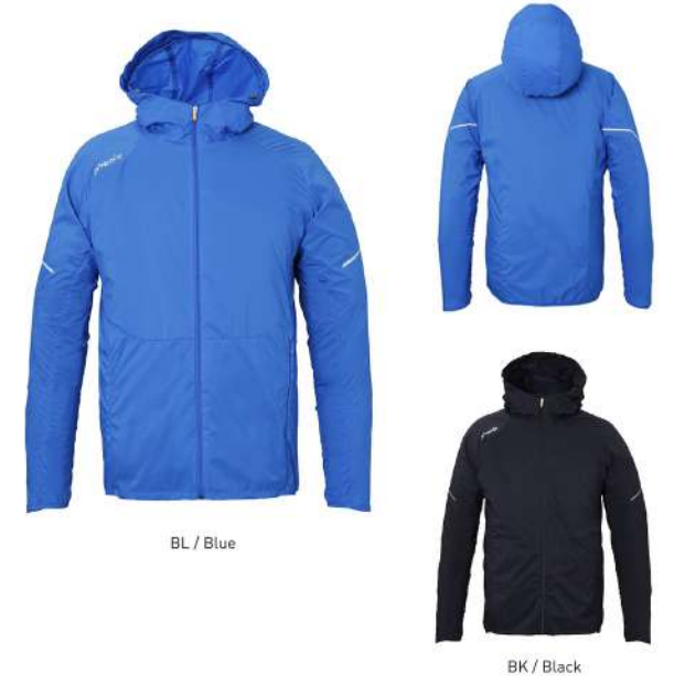
BL / Blue

【素材】PERTEX® QUANTUM AIR リップストップ(ナイロン100%) 【原産国】中国 【着丈】74cm(L)