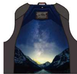
Lining Print Image 「Victory Road」