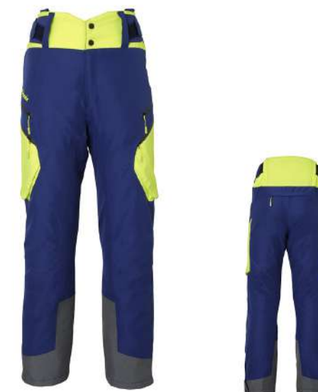
LNV / Light Navy