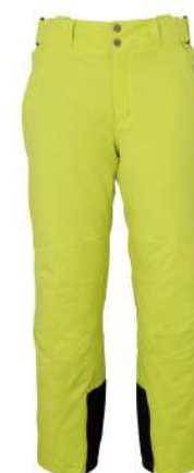
LIM2 / Lime2