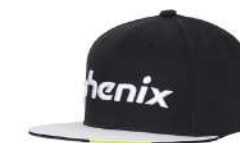
BKWT / Black White