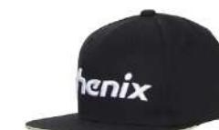
BK / Black