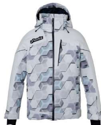
WT / White