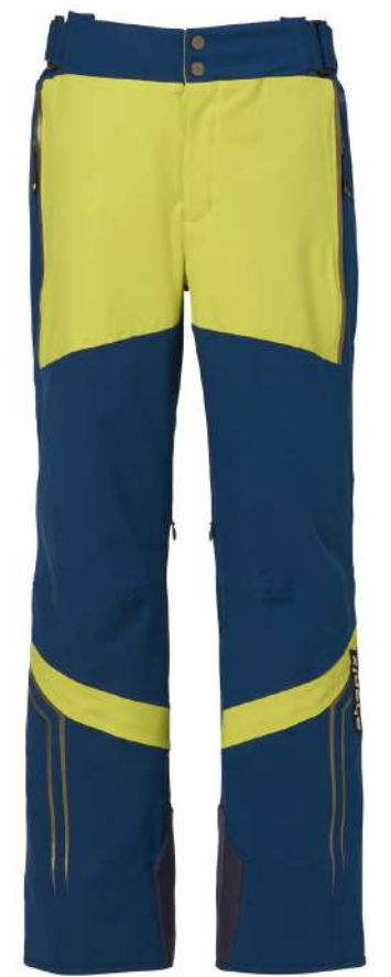
IN / Ink Blue