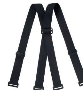
BK / Black