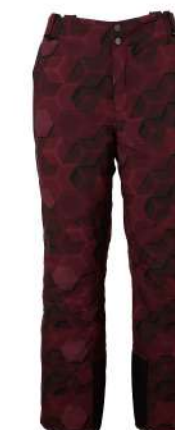
BO / Bordeaux