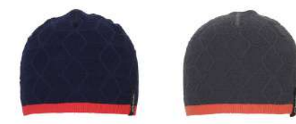
DN / Dark Navy CG / Charcoal Gray