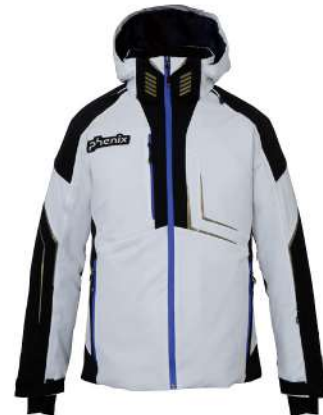
SW / Silver White