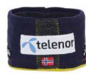
MN / Midnight