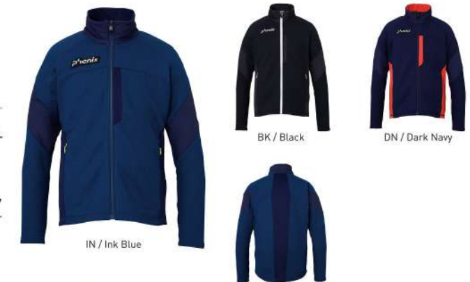
IN / Ink Blue

【素材】〈表〉セーター調ボンディングニット(ポリエステル100%)、シングルサイドフリース(ポリエステル93%、ポリウレタン7%)、2-wayストレッチ20dナイロンウーリーリップストップ(ナイロン100%) 【原産国】中国 【着丈】73cm (L)