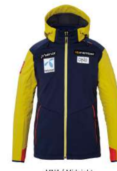
MN1 / Midnight