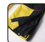
フルオープンファスナー