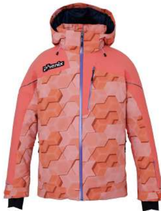
CO / Coral