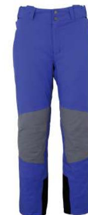
RB1 / Royal Blue1