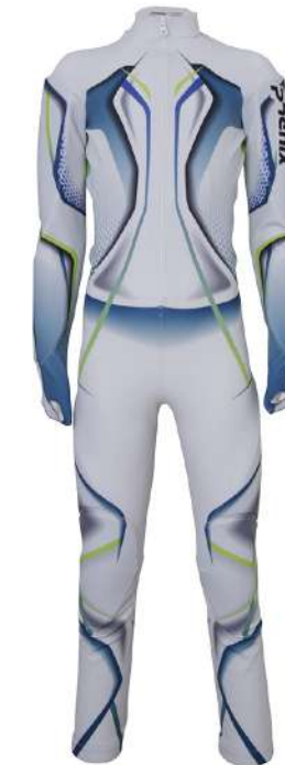
WT / White

【素材】レーシングトリコット(ポリエステル80%、ポリウレタン20%) 【原産国】フランス