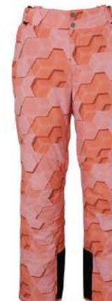
CO / Coral