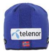
RB / Royal Blue