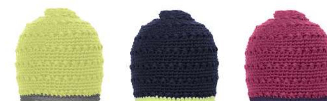
FYE / Flash Yellow LNV / Light Navy PK / Pink