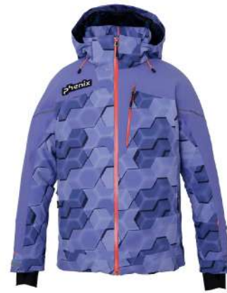
VI / Violet