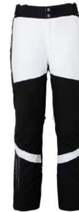
BK / Black