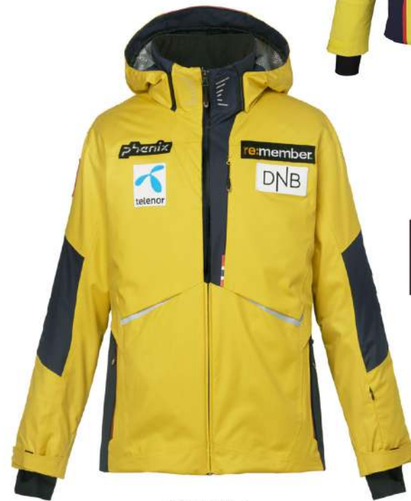
GY1 / Gold Yellow1