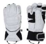
WT / White