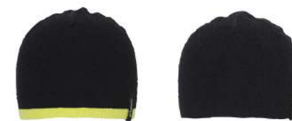
BK1 / Black1 BK2 / Black2

【素材】[BK2, DN] ニット(ポリエステル79%、ポリウレタン21%) [BK1, CG] ニット(ポリエステル74%、ポリウレタン21%、アクリル5%) 【原産国】中国