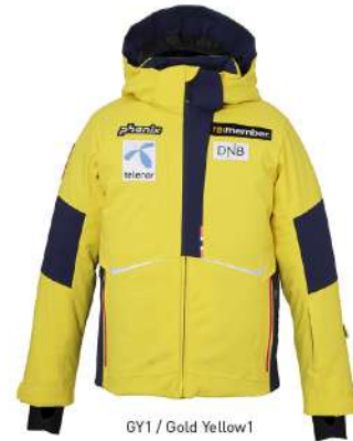
GY1 / Gold Yellow1