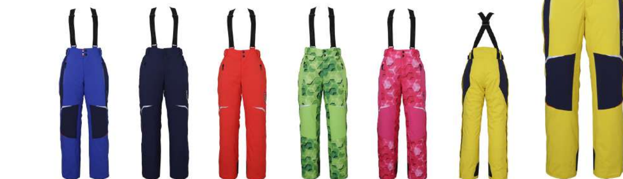
RB1 / Royal Blue1 DN / Dark Navy FLRD / Flame Red YG / Yellow Green PK / Pink