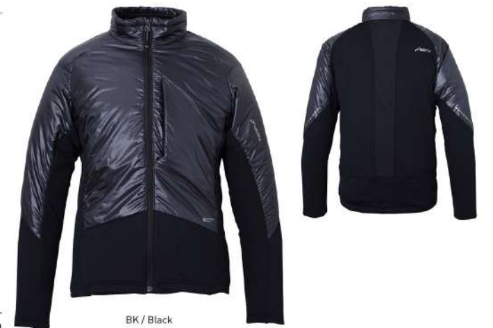
BK / Black