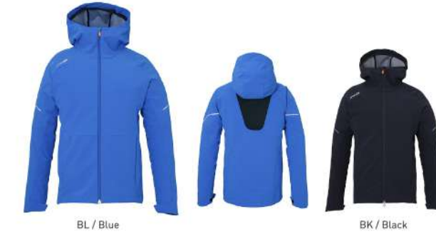
BL / Blue

【素材】4-wayストレッチタフバックサイドニット3L(ポリエステル86%、ポリウレタン14%[ポリエステル100%])、ストレッチダブルフェイスニット(ポリエステル95%、ポリウレタン5%) 【原産国】中国 【着丈】74cm(L)