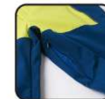
ベンチレーション

【素材】〈表〉4-wayストレッチツイル2L(ポリエステル100%)、CORDURA オックス(ナイロン100%) 〈裏〉トリコット(ポリエステル100%)、タフタ(ポリエステル100%)、ブラッシュドトリコット(ポリエステル100%)、ナイロントリコットストレッチ(ナイロン82%、ポリウレタン18%) 〈中わた〉Thunderon® DIGENITE THERMO、ポリエステル100%(ポリエステル94%、アクリル6%) 【原産国】中国 【股下】80cm(L)