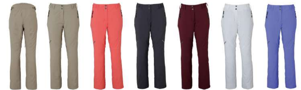
BE / Beige