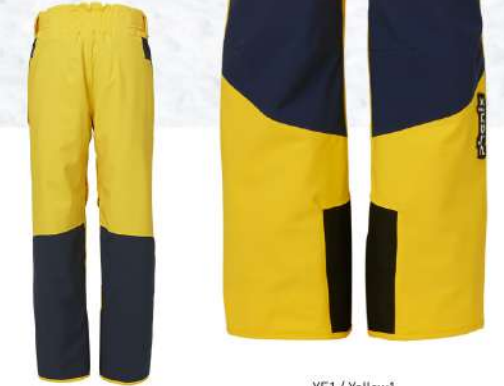
YE1 / Yellow1