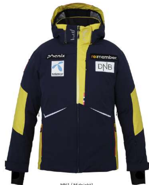
MN1 / Midnight1