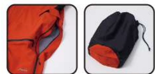
ベンチレーション

【素材】(表)GORE-TEX® PRO 3L(ナイロン100% [ナイロン100%])、CORDURA® オックス(ナイロン100%)、4-wayストレッチトリコットメッシュ(ポリエステル82%ポリウレタン18%)、ナイロントリコットストレッチ(ナイロン82%ポリウレタン18%) 【原産国】中国 【股下】80cm(L)