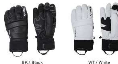
BK / Black WT / White

【素材】〈甲側〉やぎ革 〈平側〉やぎ革、合成皮革、ナイロン、ポリウレタン 〈裾口〉合成ゴム 【原産国】ベトナム