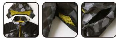
取り外し可能フード 胸ベンチレーション バックサイド大容量ポケット