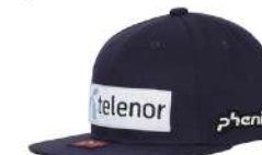
MN / Midnight