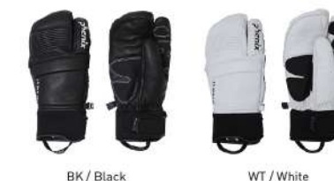
BK / Black WT / White

【素材】〈甲側〉やぎ革 〈平側〉やぎ革、合成皮革、ナイロン、ポリウレタン 〈裾口〉合成ゴム 【原産国】ベトナム