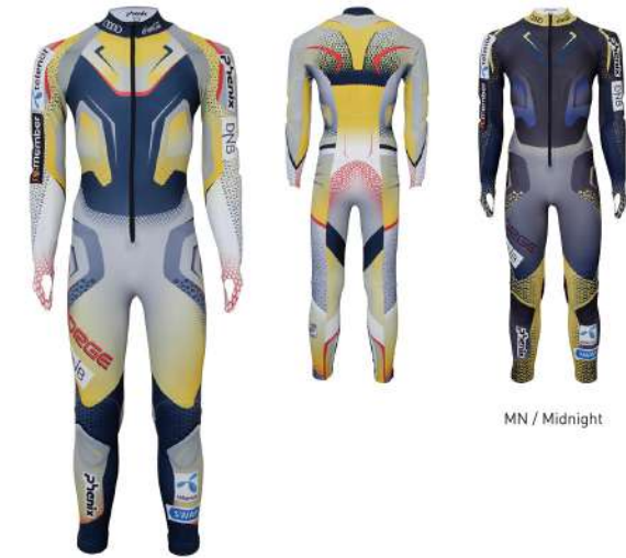
MN / Midnight

【素材】レーシングトリコット(ポリエステル80%、ポリウレタン20%) 【原産国】フランス