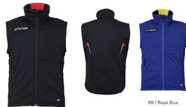
BK / Black

【素材】AEROTHERMO®3L [バックサイドJQフリース] (ポリエステル100% [ポリエステル100%]) 【原産国】中国 【着丈】69cm (L)