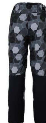
BK / Black