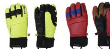
LIM / Lime FLRD / Flame Red