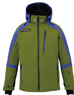
LE / Leaf Green