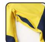
ベンチレーション

【素材】〈表〉4-wayストレッチタフタ2L(ポリエステル100%)、CORDURA オックス(ナイロン100%) 〈裏〉トリコット(ポリエステル100%)、タフタ(ポリエステル100%)、ブラッシュドトリコット(ポリエステル100%) 〈中わた〉Thunderon® DIGENITE THERMO(ポリエステル94%、アクリル6%)、ポリエステル100% 【原産国】中国 【股下】PFA720B12/79cm(L) / PFA720B12E/75cm(W1)