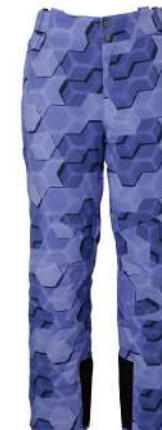
VI / Violet