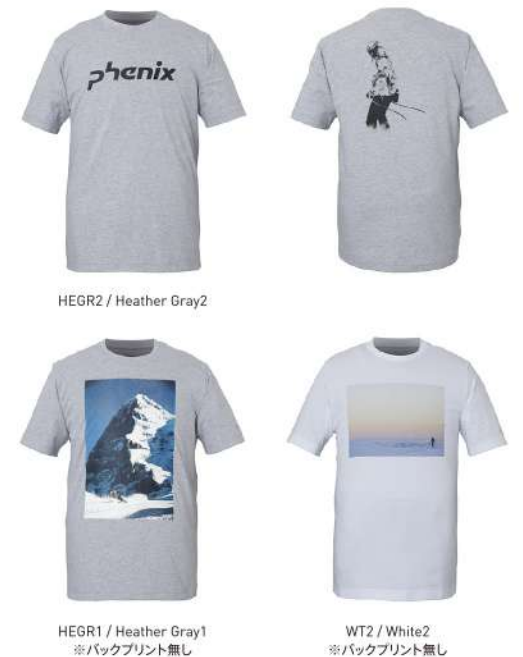
HEGR2 / Heather Gray2

【素材】T/Cプレーティング天竺(綿78%、ポリエステル22%) 【原産国】中国 【着丈】70cm(L)