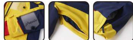
ダブルIDカードケース付き 胸ベンチレーション バックサイド 大容量ポケット

【素材】〈表〉4-wayストレッチタフタ2L(ポリエステル100%) 〈裏〉ブラッシュドティンブルメッシュ(ポリエステル100%)、タフタ(ポリエステル100%)、ナイロントリコットストレッチ(ナイロン82%、ポリウレタン18%)、トリコット(ポリエステル100%) 〈中わた〉Thunderon® DIGENITE THERMO(ポリエステル94%、アクリル6%)、ポリエステル100% 【原産国】中国 【着丈】PFA720T12/75.5cm(L) / PFA720T12K/77cm(W1)