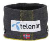
CG / Charcoal Gray

【素材】〈表〉ニット(アクリル100%) 〈裏〉吸汗速乾フリース(ポリエステル95%、ポリウレタン5%) 【原産国】中国