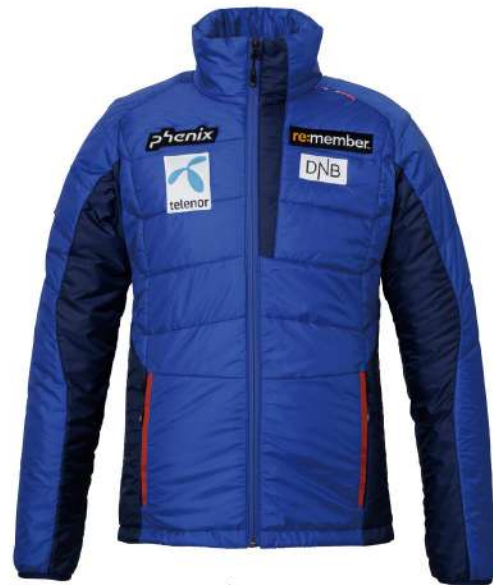
RB1 / Royal Blue1

【素材】〈表〉ライトウェイトリップストップ(ポリエステル100%) 〈裏〉ライトウェイトタフタ(ナイロン100%) 〈中わた〉PRIMALOFT® SILVER INSULATION(ポリエステル100%)、ポリエステル100% 【原産国】中国 【着丈】71.5cm(M/50)