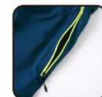
ベンチレーション

【素材】(表)4-wayストレッチツイル2L(ポリエステル100%)、CORDURAオックス(ナイロン100%) (裏)トリコット(ポリエステル100%)、タフタ(ポリエステル100%)、ブラッシュドトリコット(ポリエステル100%) (中わた)Thunderon® DIGENITE THERMO(ポリエステル94%、アクリル6%)、ポリエステル 100% 【原産国】中国 【着丈】79cm(L)