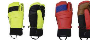
LIM / Lime FLRD / Flame Red