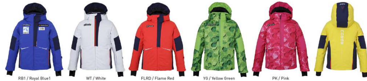
RB1 / Royal Blue1 WT / White FLRD / Flame Red YG / Yellow Green PK / Pink