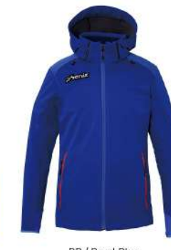
RB / Royal Blue