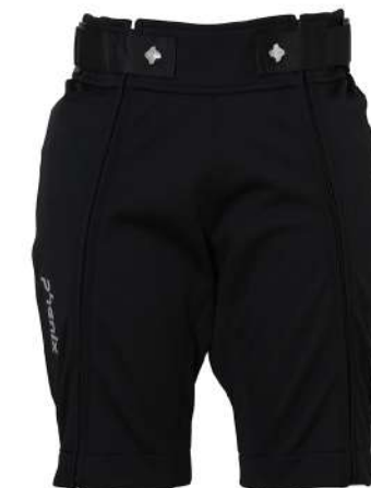
BK / Black