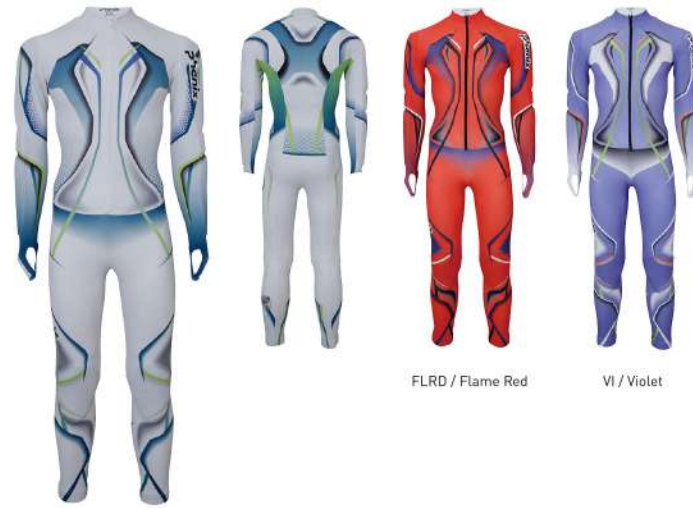
WT / White

【素材】レーシングトリコット(ポリエステル80%、ポリウレタン20%) 【原産国】フランス