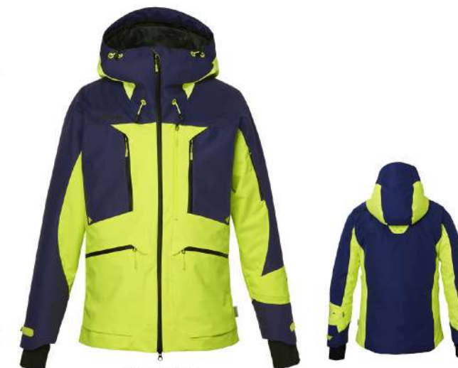
LNV / Light Navy