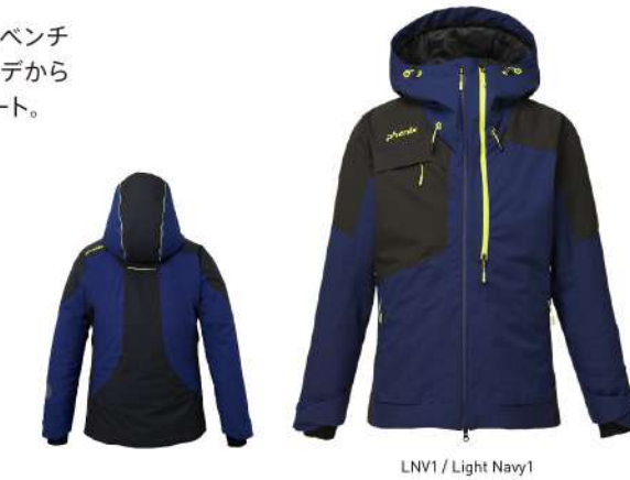
LNV1 / Light Navy1