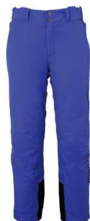
RB2 / Royal Blue2