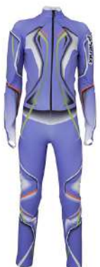
VI / Violet