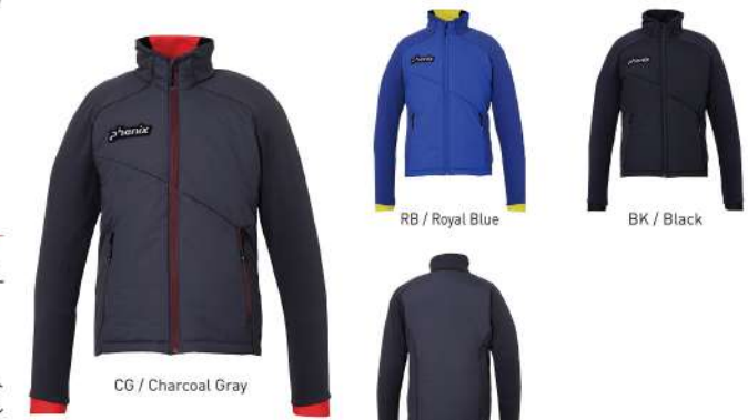
CG / Charcoal Gray

【素材】〈表〉シングルサイドフリース(ポリエステル93%、ポリウレタン7%)、2-wayストレッチ20dナイロンウーリーリップストップ(ナイロン100%) (裏) タフタ(ポリエステル100%) (中わた) Thunderon® DIGENITE THERMO (ポリエステル94%、アクリル6%) 【原産国】中国 【着丈】69cm (L)