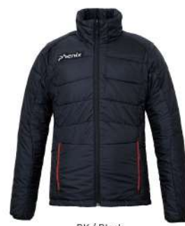
BK / Black