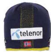
MN / Midnight