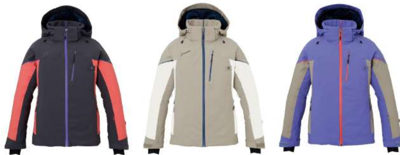
CG / Charcoal Gray