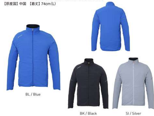
BL / Blue

【素材】2WAYストレッチライトクロス(ナイロン71%、ポリエステル18%、ポリウレタン11%)、ストレッチダブルフェイスニット(ポリエステル95%、ポリウレタン5%) 【原産国】中国 【着丈】74cm(L)