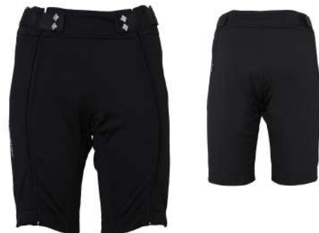
BK / Black

【素材】AEROTHERMO®3L [バックサイドJQフリース] (ポリエステル100% [ポリエステル100%]) 【原産国】中国 【股下】30cm (L)