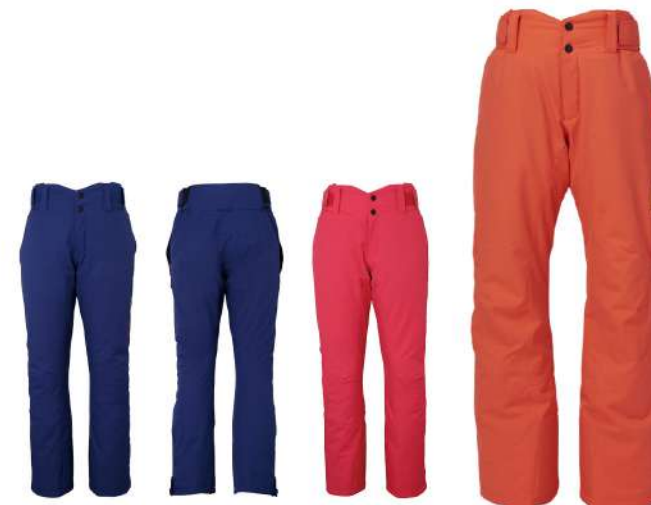
LNV / Light Navy