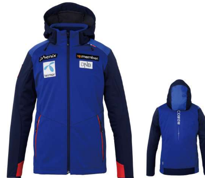
RB1 / Royal Blue1

【素材】AEROTHERMO®3L [バックサイドJQフリース] (ポリエステル100%) [ポリエステル100%], ライトウェイトリップストップ(ポリエステル100%)、リップ(ポリエステル100%) 【原産国】中国 【着丈】73cm(M/50)