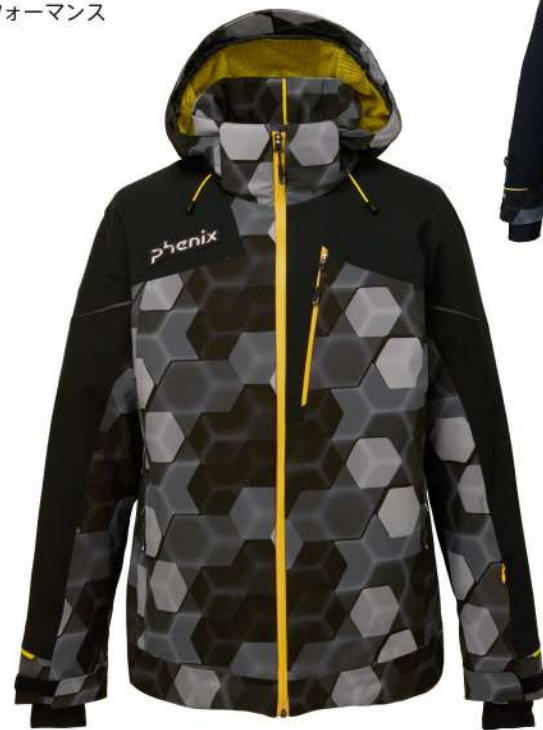
BK / Black