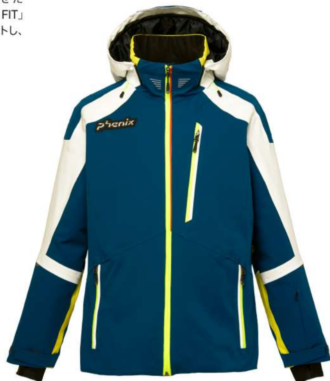
IN / Ink Blue