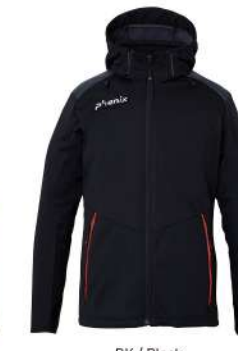
BK / Black