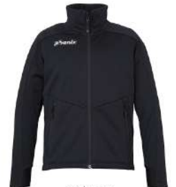
BK / Black