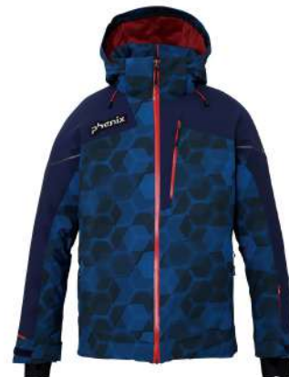
IN / Ink Blue