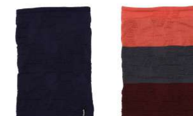
DN / Dark Navy BO / Bordeaux