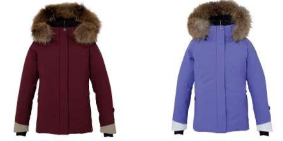
BO / Bordeaux