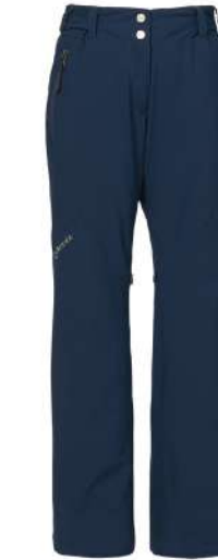
IN / Ink Blue