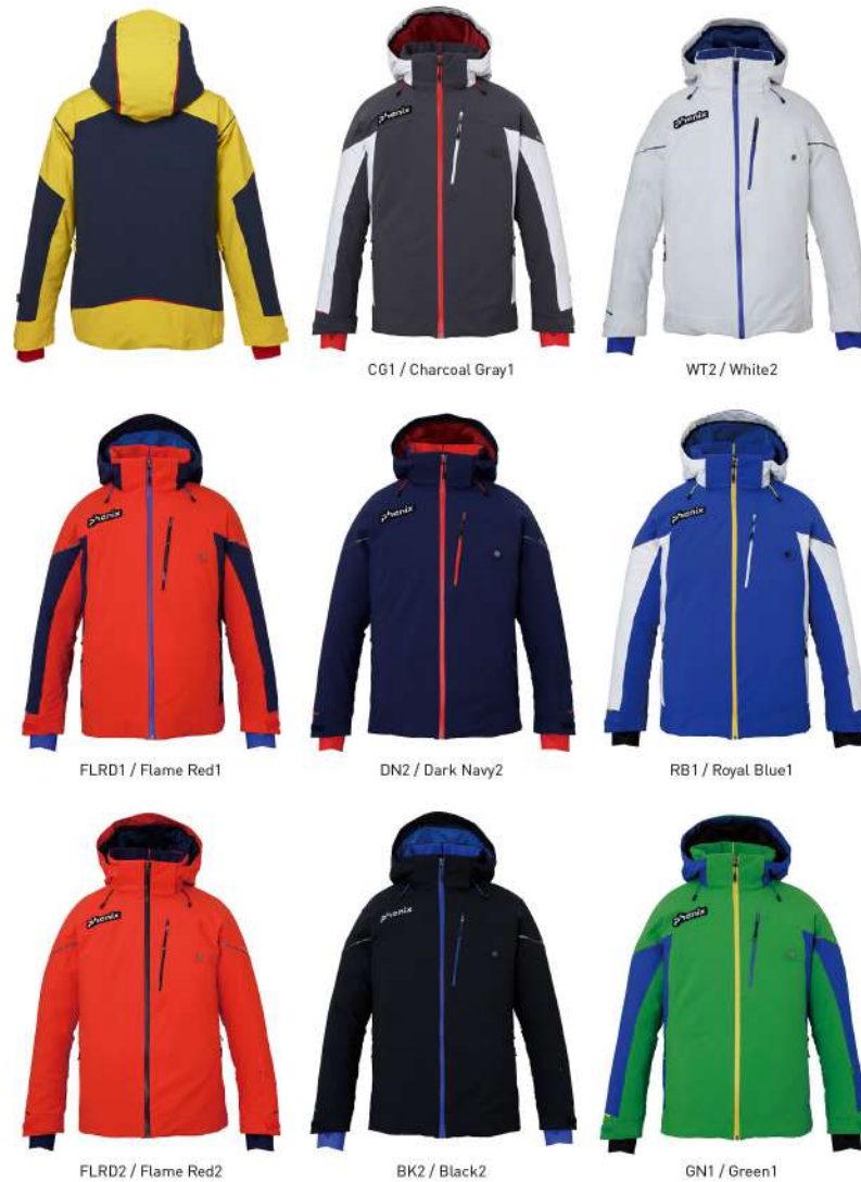
FLRD2 / Flame Red2 BK2 / Black2 GN1 / Green1