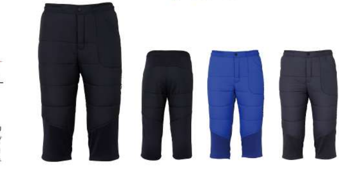
CG / Charcoal Gray

【素材】〈表〉シングルサイドフリース(ポリエステル93%、ポリウレタン7%)、2-wayストレッチ20dナイロンウーリーリップストップ(ナイロン100%) (裏) タフタ(ポリエステル100%) (中わた) Thunderon® DIGENITE THERMO (ポリエステル94%、アクリル6%) 【原産国】中国 【股下】50cm (L)