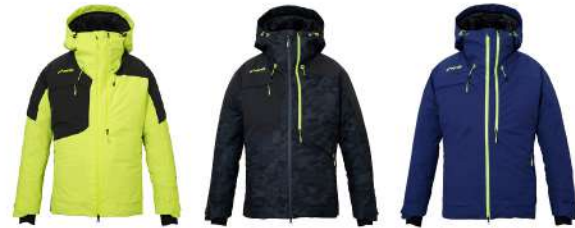
FYE / Flash Yellow