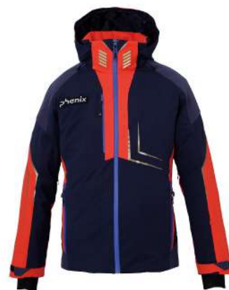
MN / Midnight