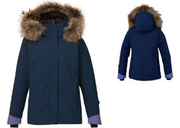
IN / Ink Blue