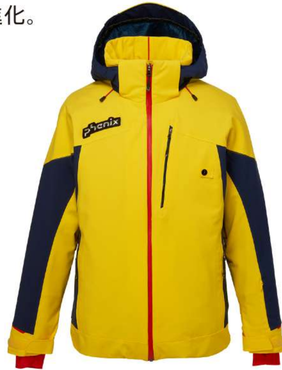
YE1 / Yellow1