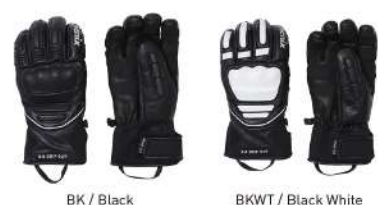
BK / Black BKWT / Black White