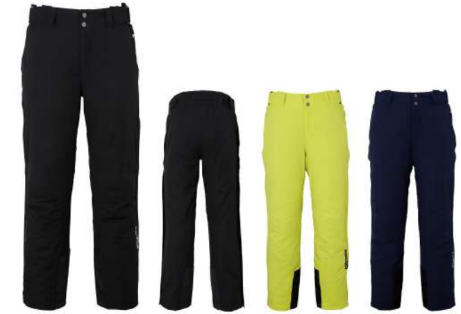
BK / Black

【素材】〈表〉4-wayストレッチツイル2L (ポリエステル100%)、CORDURAオックス(ナイロン100%) (裏) トリコット(ポリエステル100%)、タフタ(ポリエステル100%)、フラッシュトリコット(ポリエステル100%) 〈中わた〉Thunderon® DIGENITE THERMO (ポリエステル94%、アクリル6%)、ポリエステル100% 【原産国】中国 【股下】79cm (L)