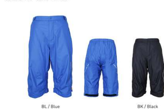
BL / Blue

【素材】GORE-TEX® PRODUCTS WITH PACLITE® PLUS PRODUCT TECHNOLOGY(ナイロン100%) 【原産国】中国 【着丈】41cm(L)