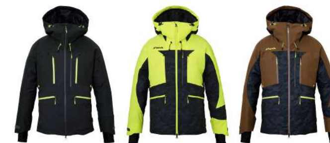
CG / Charcoal Gray