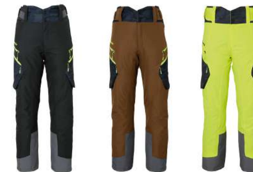
CG / Charcoal Gray