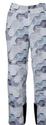
WT / White