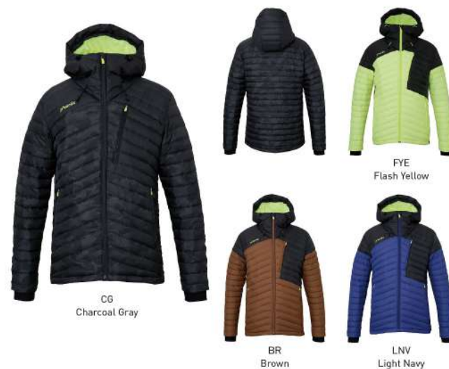
CG Charcoal Gray

【素材】〈表〉[CG]カモフラージュプリントライトウェイトリップストップ(ポリエステル100%)、ライトウェイトタフタ(ナイロン100%)、salakalaビンメッシュ[FYE,BR,LNV]ライトウェイトタフタ(ナイロン100%)、salakalaビンメッシュ 〈中わた〉ダウン(ダウン90%、フェザー10%)、ポリエステル100% 【原産国】中国 【着丈】71cm(L) 【ダウン量】135g(L)