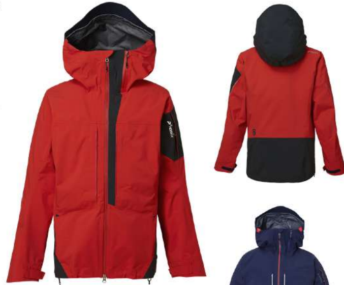
FLRD / Flame Red