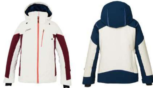
WT / White