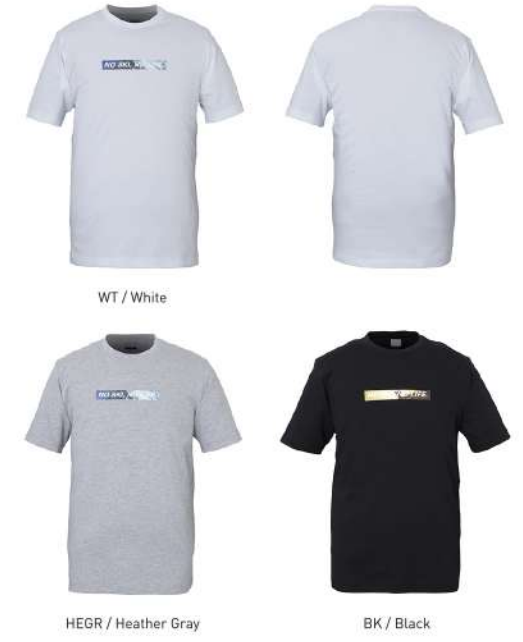
WT / White

【素材】T/Cプレーティング天竺(綿78%、ポリエステル22%) 【原産国】中国 【着丈】70cm(L)