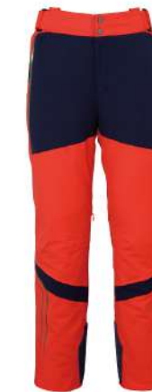
FLRD / Flame Red