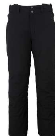
BK2 / Black2