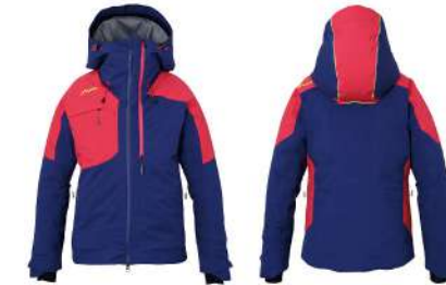
LNV / Light Navy