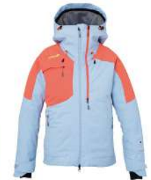
IBL / Ice Blue