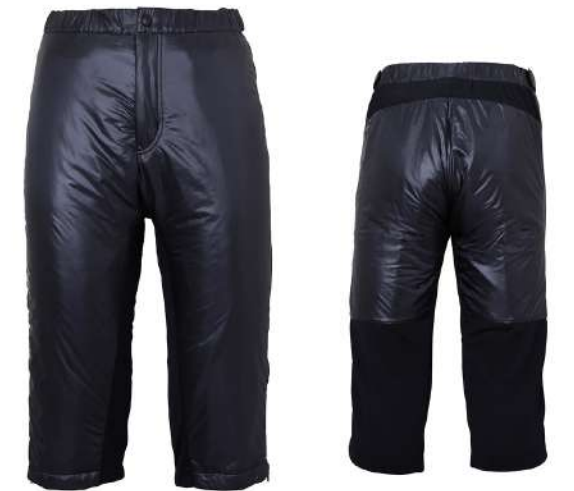
BK / Black