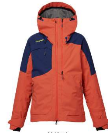
CO / Coral