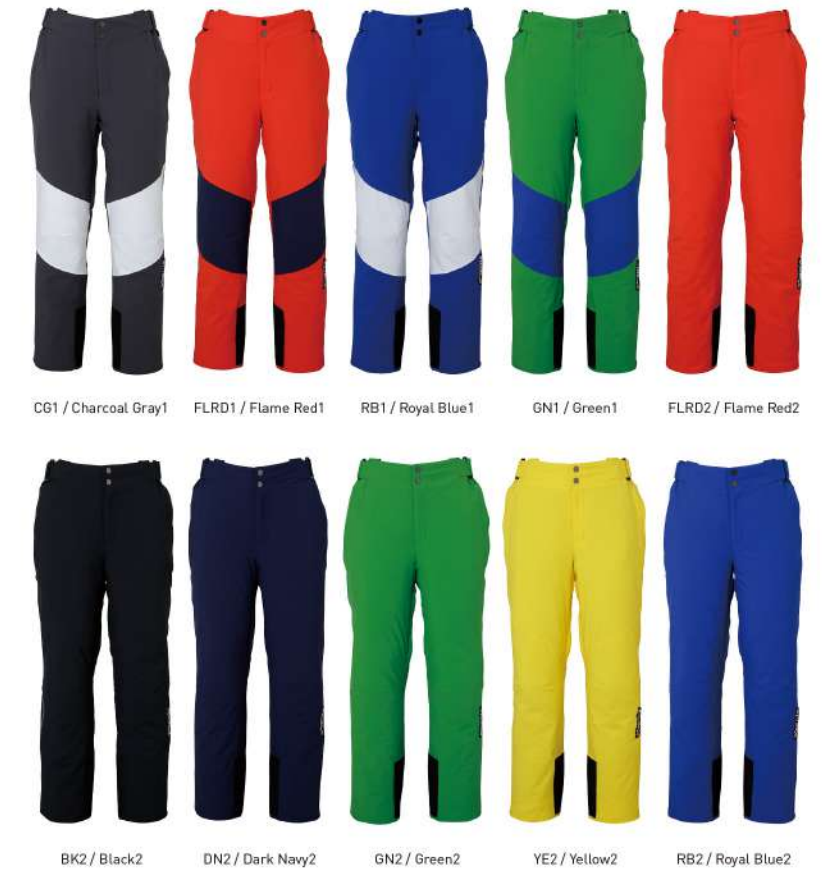
BK2 / Black2 DN2 / Dark Navy2 GN2 / Green2 YE2 / Yellow2 RB2 / Royal Blue2