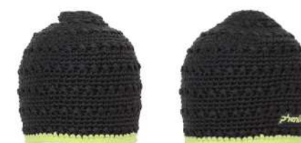
CG / Charcoal Gray

【素材】〈表〉ニット(アクリル100%) 〈裏〉吸汗速乾フリース(ポリエステル95%、ポリウレタン5%) 【原産国】中国