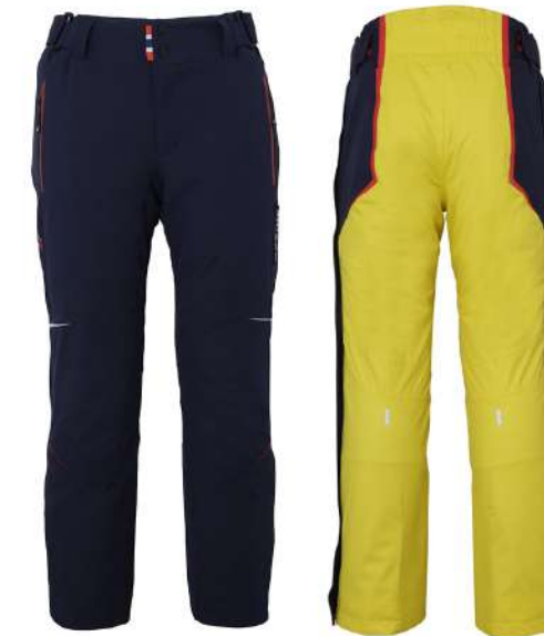
MN / Midnight