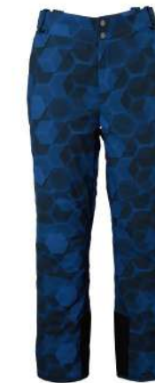
IN / Ink Blue