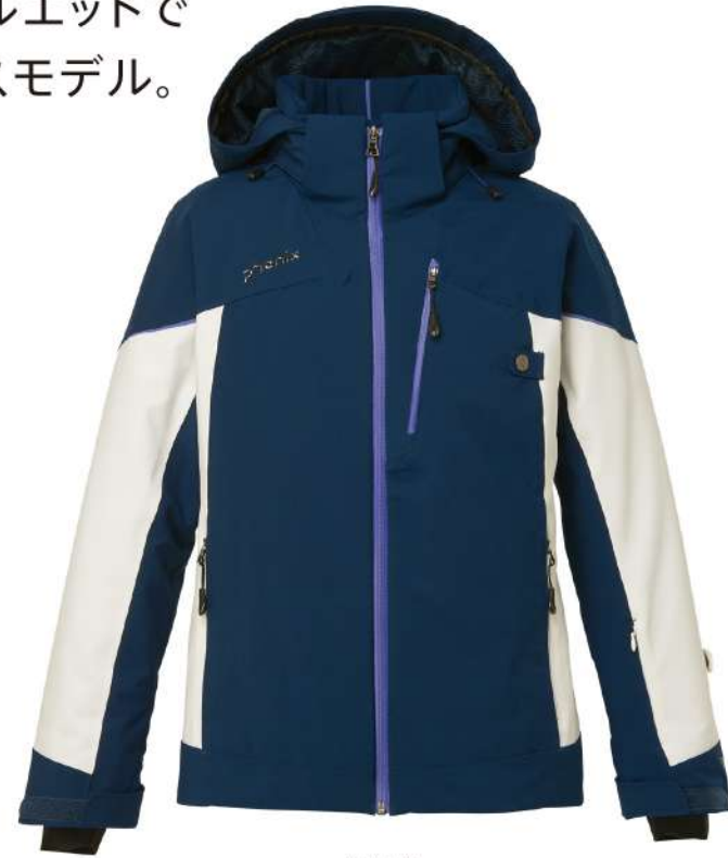
IN / Ink Blue