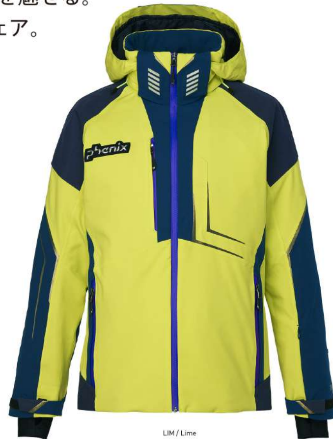
LIM / Lime