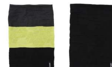
BK1 / Black1 BK2 / Black2

【素材】〈表〉ニット(アクリル97%、ポリウレタン3%) 〈裏〉吸汗速乾フリース(ポリエステル95%、ポリウレタン5%) 【原産国】中国