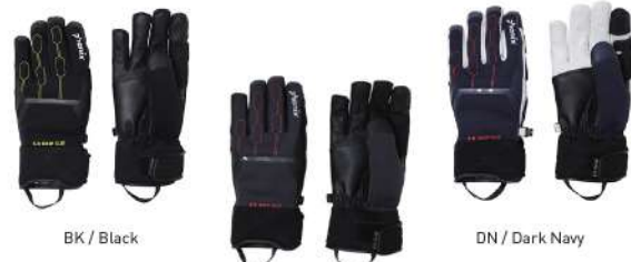
BK / Black DN / Dark Navy CG / Charcoal Gray

【素材】〈甲側〉ストレッチスクエアニット2L(ナイロン91%、ポリウレタン9%) 〈マチ〉4-wayストレッチタフタ2L(ポリエステル87%、ポリウレタン13%) 〈平側〉合成皮革、ナイロン、ポリウレタン 〈裾口〉合成ゴム 【原産国】ベトナム