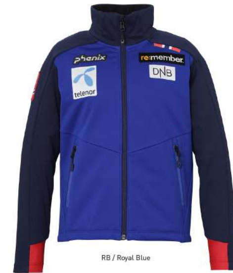
RB / Royal Blue