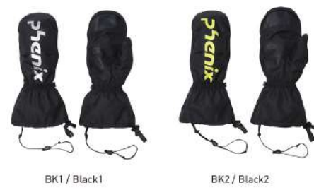
BK1 / Black1 BK2 / Black2

【素材】〈甲側〉ポリエステルタフタ3L(ポリエステル100%) 〈平側〉合成皮革 【原産国】ベトナム