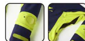
ウォッチウィンドウ 無縫レーザー切

【素材】〈表〉[LNV,CG] GORETEX® INFINIUM OX 2L (ポリエステル100%)、2-way ストレッチツイル2L (ポリエステル100%) [FYE,BR] GORETEX® INFINIUM OX 2L (ポリエステル100%)、カモフラージュプリント2-wayストレッチツイル2L (ポリエステル100%) 〈裏〉タフタ (ポリエステル100%)、トリコット (ポリエステル100%)、ナイロントリコットストレッチ (ナイロン82%、ポリウレタン18%) 【原産国】中国 【着丈】78cm (L)